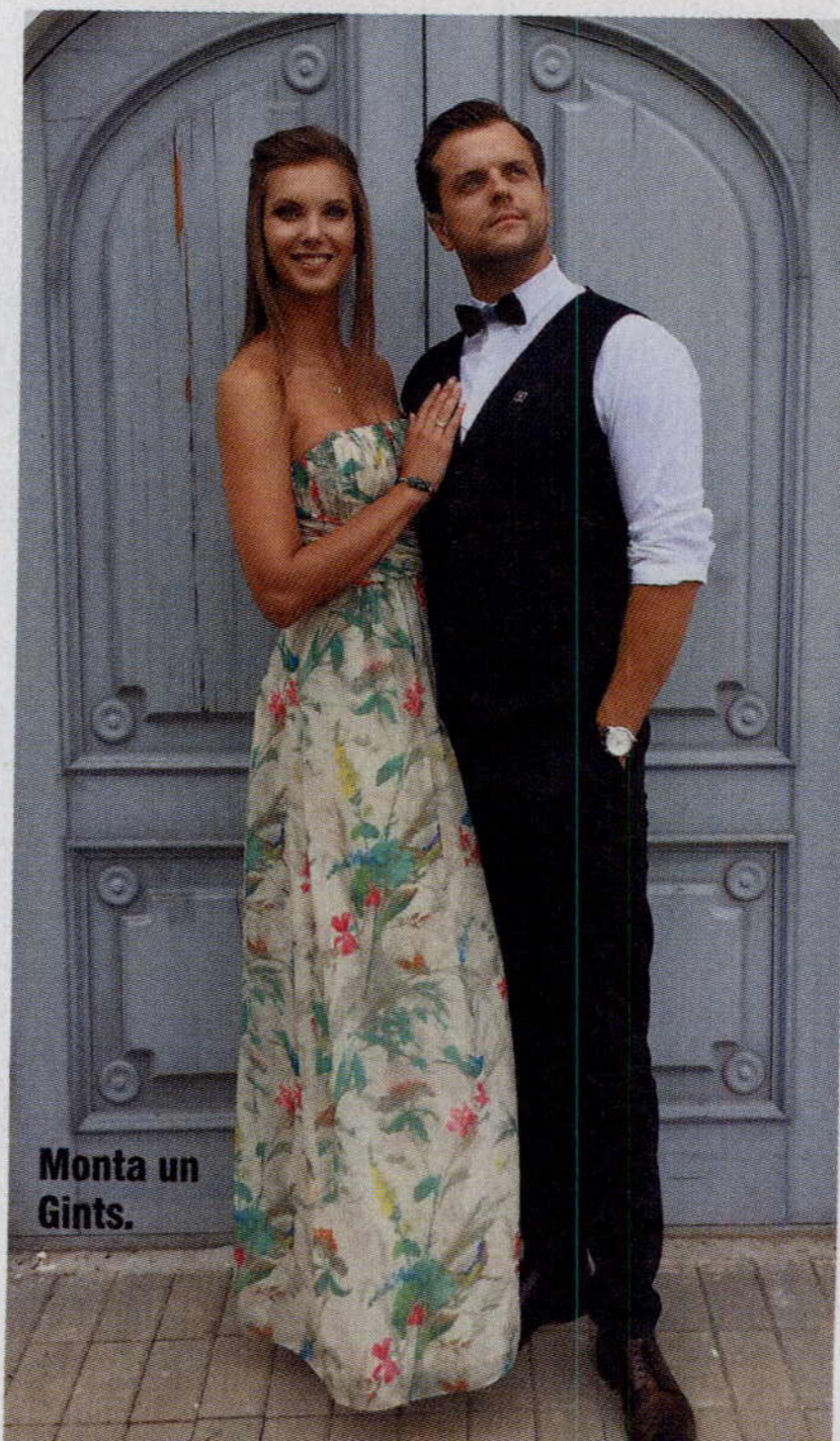
Monta un Gints.

Naudai jāglabājas pie tiem, kas prot gudri ar to rīkoties, un mūsu ģimenē tā ir sieva.