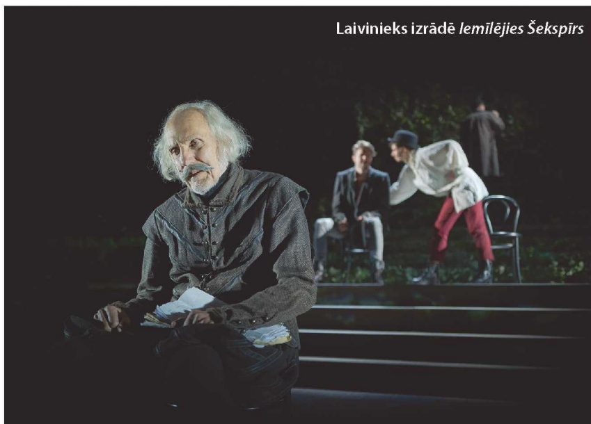
Laivinieks izrādē Jemīlējies Šekspīrs

apkārt pa Eiropu. Vēstures atblāzmu un vienlaikus šabriža sajūtu esmu pieredzējis Itālijā, Grieķijā, Portugālē, Spānijā... Arī Norvēģijā, Zviedrijā, Somijā. Vai arī vienkārši mana iztēle ir ierosināta un sāk darboties aktīvāk.