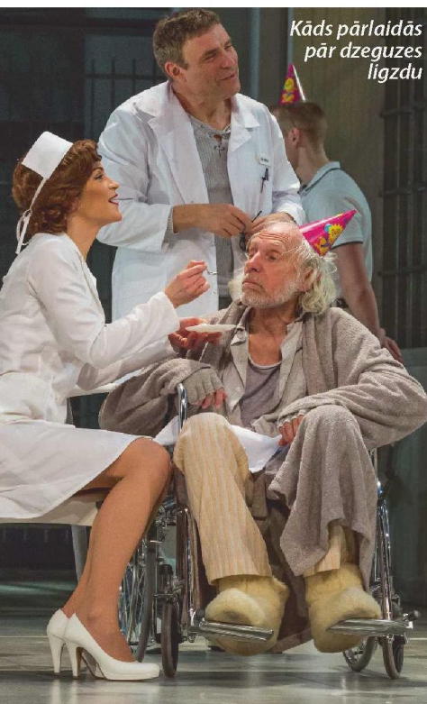
Kāds pārlaidās pār dzeguzes ligzdu