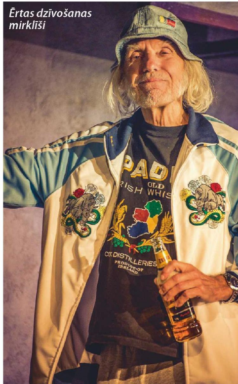
Ērtas dzīvošanas mirklīši

Katram jau ir pašam savi kodeksi. Vai tādi vispārēji darbojas, kad tie sarakstīti, vai pēc tiem kāds arī dzīvo? Jo visi likumi jau ir tādēļ, lai tos pārkāptu. Vissaldākais ir brīdis, kad tu pārkāp kodeksus.