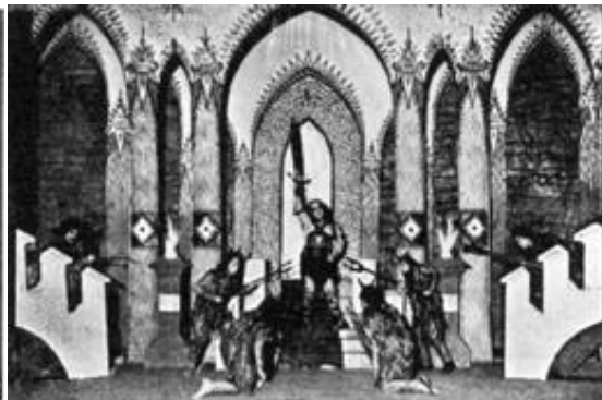
"Uguns un nakts"

„Toreiz uz skatuves mēs tiešām daudz dejojām, bet deja nekad nedrīkstēja būt par atsevišķu spožu numuru, tā bija izrādes kolorīta komponents, vides akcents. Smilģis prasīja filigrāni izkoptu stilu, visu izteiksmes līdzekļu virtuozitāti, tāpēc tik liela uzmanība tika pievērsta aktiera ķermeņa tehnikai, ritma izjūtai, žesta izteiksmībai. Kamēr viss vēl nebija kļuvis organisks, pārspilējumi bija neizbēgami. Mērķis bija skaidrs – forma, kas atbilstu saturam, turklāt emocionāli sakāpināta forma.”