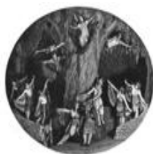
"Sapnis vasaras naktī"