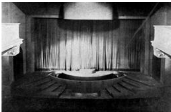
Amatnieku biedrības zāle 30. gadu sākumā

Atskatoties uz Dailes teātra pirmajām desmit sezonām, Eduards Smilģis tās raksturojis tā: