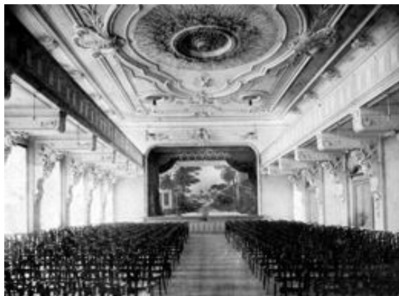
Rīgas Latviešu amatnieku palīdzības biedrības nama zāle