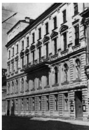
Romanova iela, tagadējā Lāčplēša iela 25

Nams, kurā kopš 1920. gada līdz 1977. gadam (darbnīcas līdz pat 1991. gadam) mitinājās Dailes teātris , Romanova, tagadējā Lāčplēša iela 25 (par Lāčplēša ielu to pārdēvēja 1923. gadā).