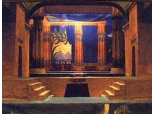
Viens no maketiem, kas tika izstādīts Parīzē - B.Šova "Cēzars un Kleopatra"

„Dailes teātris 20. novembrī svinēja savas darbības piecu gadu svētkus ar Kārļa Ābeles „Ligatūru” 38 ainās. Nolūks bija – parādīt, ko Dailes teātris piecu gadu laikā sasniedzis teatrālās tehnikas virtuoziatē, krāsu spilgtā pilnumā, gaismas un ēnu rotaļībā, ritmu vijīgā muzikālā plastikā. Šie sasniegumi patiešām ir apbrīnojami. Šī mazā, trūcīgā skatuvīte nebija vairs triju sienu ieslēgta nedzīva telpa. Tā bija liela teatrāla simfonija. Pēc šīs svētku izrādes nebrīnāmi vairs par to atzinību, kas Dailes teātrim nodibinājusies jau ārzemēs. Franču un citu teātru apjūsmotāji varbūt nu atskārtīs, cik liela un ievērojama māksla aug tepat mūsu mājās.”