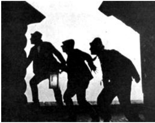
"Mežābeles koka kastīte"