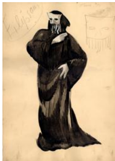
O. Skulmes „Āksta” kostīmu skices