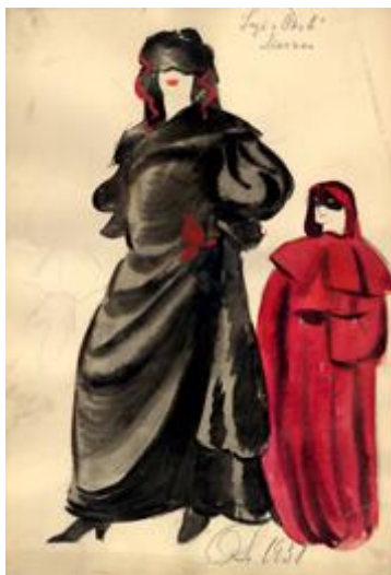
O. Skulmes „Āksta” kostīmu skices