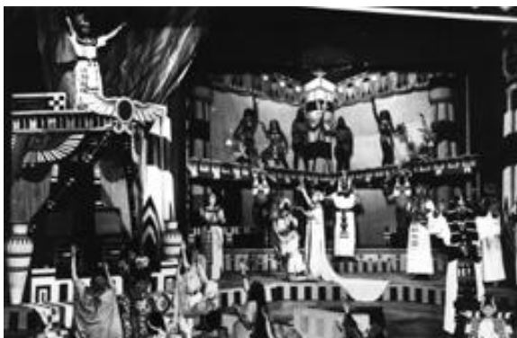
Skats no izrādes „Jāzepe un viņa brāļi”

Dailes teātra repertuārā pastāvīgi ir kāds no Raiņa darbiem.