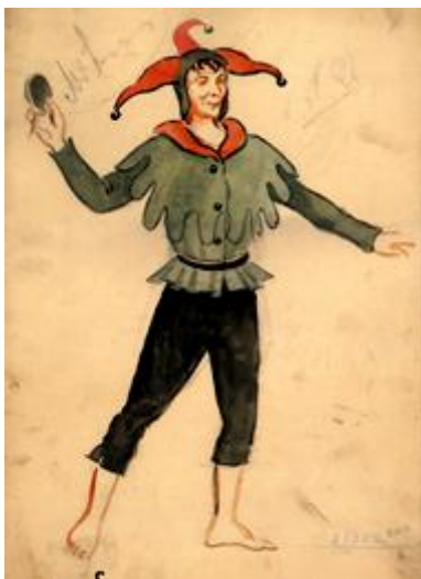
O. Skulmes „Āksta” kostīmu skices