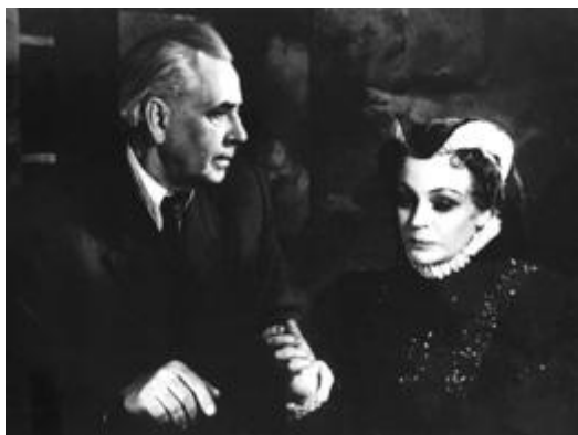
Eduards Smiļģis un Lilita Bērziņa izrādes "Marija Stjuarte" mēģinājumā